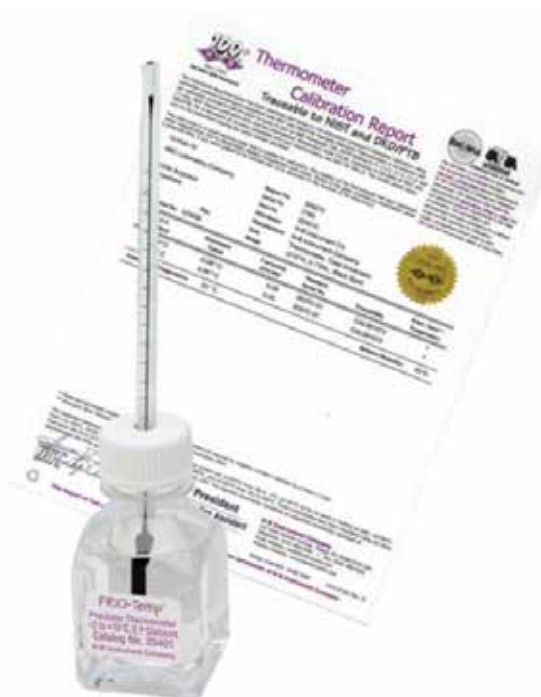
Version certifié - 2/10°C