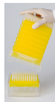
Le plateau de pointes est en place.