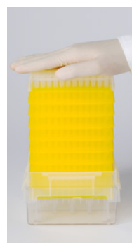
Placer la tour sur la boîte à recharger. Appuyer fermement.